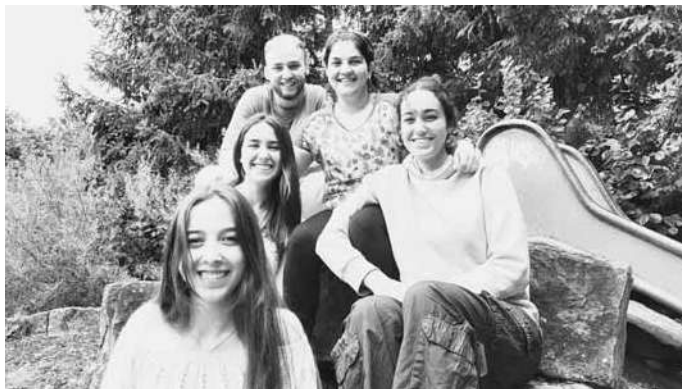
Pädagogische Fachkräfte aus Spanien

Die KiTas der Stadt Weilheim an der Teck erhalten ab Oktober tatkräftige Unterstützung von fünf jungen pädagogischen Fachkräften aus Spanien. Doch bevor es losgeht, gab es vergangene Woche ein persönliches Kennenlernen.