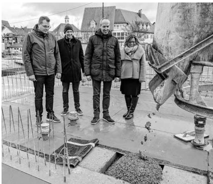
Einbetonieren der Zeitkapsel im Fundament der neuen Schulturnhalle.