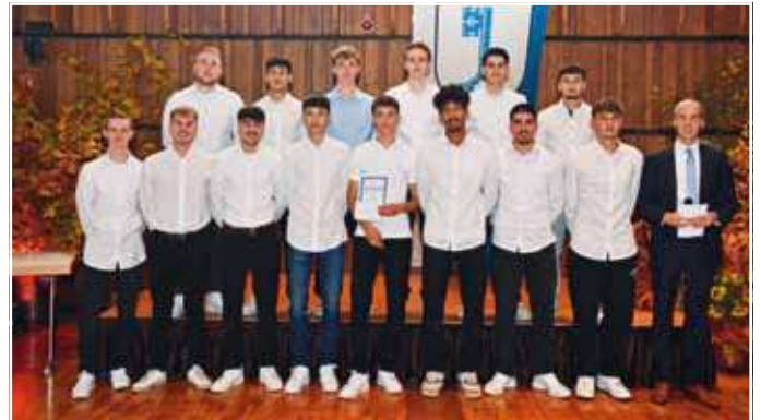
Fußball, U17 männlich